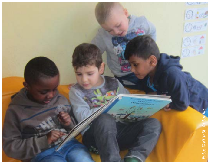
Die Kinder aus St. Antonius entdecken die Sprache.

Weitere Informationen gibt es auf der Website des Bundesprogramms „Sprach-Kitas“: http://sprach-kitas.fruehe-chancen.de/