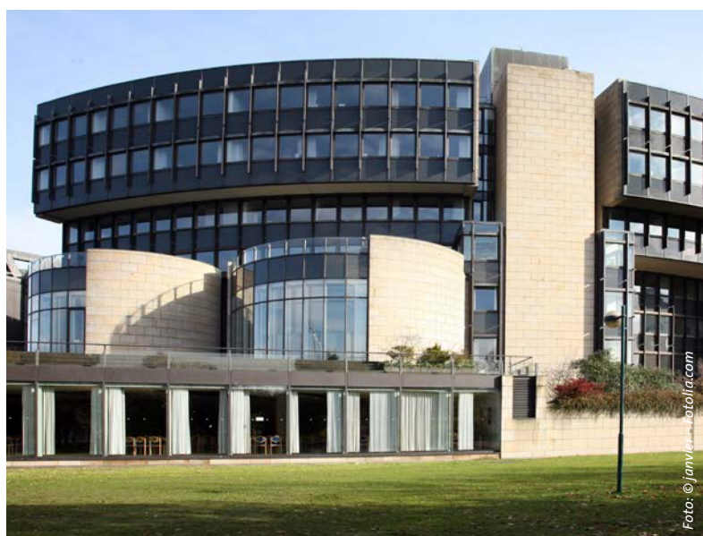
Die Mitarbeitervertretungen der katholischen Tageseinrichtungen trafen sich mit dem SPD-Arbeitskreis „Familie, Kinder und Jugend“ im Düsseldorfer Landtag.

Im April sind die Vertreter der fünf (Erz-)Bistümer Aachen, Essen, Köln, Münster und Paderborn zu einem erneuten Gespräch mit dem Arbeitskreis in Düsseldorf eingeladen. Inhaltlich geht es dann um wichtige „Eckpunkte“ für ein neues Gesetz. ■ Barbara Kahlert/Maria-Luise Marx